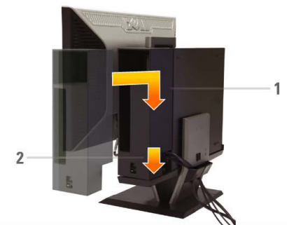
8 Connect the power cables to an outlet. Install the cable cover

Schließen Sie USB-, Tastatur- und Maus kabel wie gezeigt an den Computer an Branchez les câbles USB de la souris et du clavier à l'ordinateur tel qu'illustré Conecte los cables USB, de teclado y ratón al equipo, como muestra la imagen W pokazany sposób podłącz do komputera kabel USB, klawiatury i myszy Conecte os cabos USB, do teclado e do mouse ao computador como mostrado Collegare il cavo USB, quello della tastiera e quello del mouse al computer come mostrato